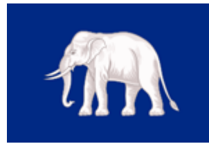
ธงเกตุ สำหรับซีกที่หัวเรือหลวง (ต่อมาใช้เป็นธงฉานของกองทัพเรือไทย)