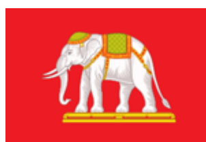
ธงราชการ พ.ศ. ๒๔๕๙