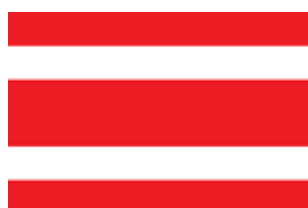
ธงคำชาย พ.ศ. ๒๔๕๙

ธงช้างเผือกเปล้าได้ใช้เป็นธงชาติสยามสืบมาจนกระทั่งในปี พ.ศ. ๒๔๕๙ เมื่อพระบาทสมเด็จพระมงกุฎเกล้าเจ้าอยู่หัว รัชกาลที่ ๖ ได้เสด็จพระราชดำเนินไปยังเมืองอุทัยธานี ซึ่งขณะนั้นประสบเหตุอุทกภัยและทอดพระเนตรเห็นธงช้างของราษฎรซึ่งตั้งใจรอรับเสด็จไว้ถูกติดกลับหัว พระองค์จึงมีพระราชดำริว่า ธงชาติต้องมีรูปแบบที่สมมาตรเพื่อไม่ให้เหตุการณ์เช่นนี้เกิดขึ้นอีก นอกจากนี้ ยังมีพระราชดำริว่า ธงช้างนั้นทำได้ยากและไม่ใคร่ได้ทำแพร่หลายในประเทศ โดยธงช้างที่ขายตามท้องตลาดนั้น มักจะเป็นธงที่ผลิตจากต่างประเทศและประเทศที่ไม่รู้จักช้าง ดังนั้น รูปร่างของช้างที่ปรากฏจึงไม่น่าดูจึงทรงพระกรุณาโปรดเกล้าฯ ให้เปลี่ยนรูปแบบธงชาติอีกครั้ง โดยเปลี่ยนเป็นธงรูปสี่เหลี่ยมผืนผ้า มีแถบยาวสีแดง ๓ แถบ สลับกับแถบสีขาว ๒ แถบ ซึ่งเหมือนกับธงชาติไทยในปัจจุบันนี้ แต่มีเพียงสีแดงเพียงสีแดงเท่านั้น ซึ่งธงนี้เรียกว่าธงแดงขาว ๕ ริ้ว (ชื่อในเอกสารราชการเรียกว่า ธงคำชาย) ทั้งนี้ สำหรับหน่วยงานราชการของรัฐบาลสยามยังคงใช้ธงช้างเผือกเป็นสัญลักษณ์ แต่ใช้รูปช้างเผือกแบบทรงเครื่องยืนแท่น ซึ่งแต่เดิมธงนี้เป็นธงสำหรับเรือหลวงมาตั้งแต่ พ.ศ. ๒๔๔๐ และมีฐานะเป็นธงราชการอยู่ก่อนแล้วตั้งแต่ พ.ศ. ๒๔๕๓